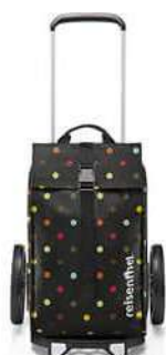
MJ 7009 dots