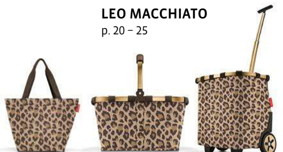
LEO MACCHIATO p. 20 – 25