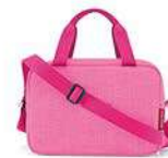
ZK 3094* twist pink