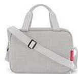
ZK 1035 twist sky rose