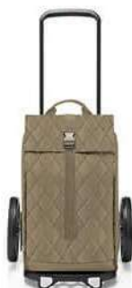
MJ 5046 rhombus olive