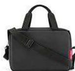
ZK 7003 black