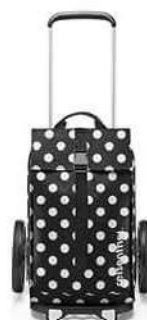
MJ 7073* dots white