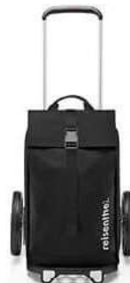
MJ 7003 black