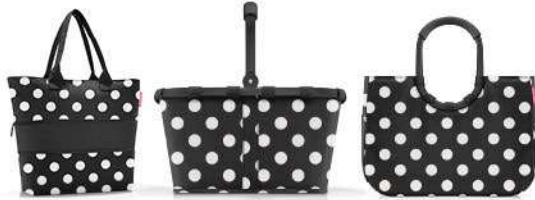
DOTS WHITE p. 6 – 13