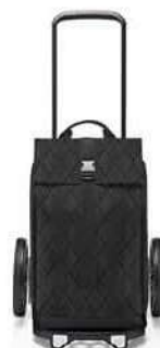
MJ 7059 rhombus black