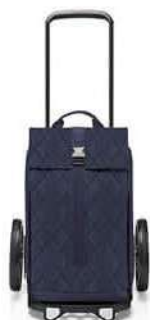
MJ 4110 rhombus midnight

AUSLIEFERUNG/DELIVERY: FEBRUAR/FEBRUARY 2024