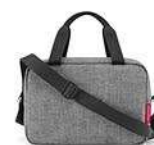
ZK 7052 twist silver