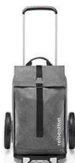
MJ 7052 twist silver