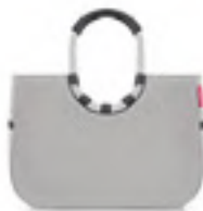
OR 7074 loopshopper L VE/UNIT 4/12