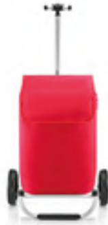
MH 3004 red