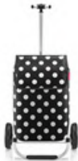
MH 7073 dots white