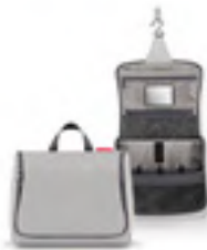
WO 7074 toiletbag XL VE/UNIT 6/24