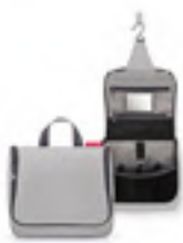
WH 7074 toiletbag VE/UNIT 6/36