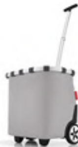
OE 7074 carrycruiser VE/UNIT 1/1