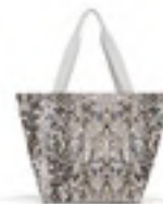
ZS 1040 shopper M VE/UNIT 6/24