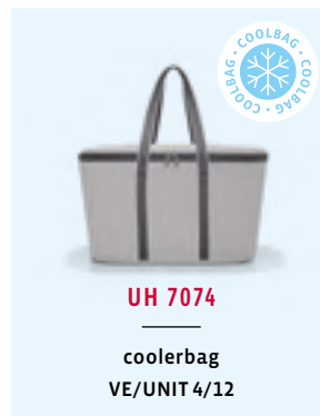
UH 7074 coolerbag VE/UNIT 4/12