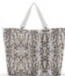
ZU 1040 shopper XL VE/UNIT 6/12