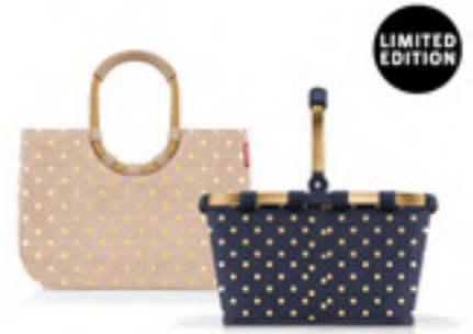
METALLIC DOTS COFFEE/BLUE