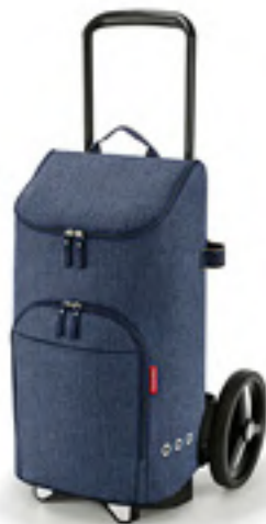
CITYCRUISER RACK & BAG