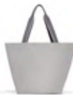
ZS 7074 shopper M VE/UNIT 6/24