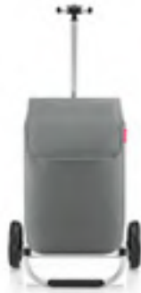
MH 1025 grey