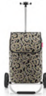
MH 7061 baroque marble