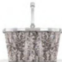
BK 1040 carrybag VE/UNIT 4/12