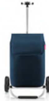
MH 4059 dark blue