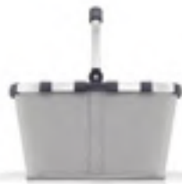
BK 7074 carrybag VE/UNIT 4/12