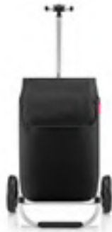
MH 7003 black