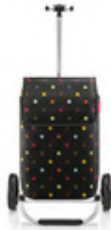
MH 7009 dots